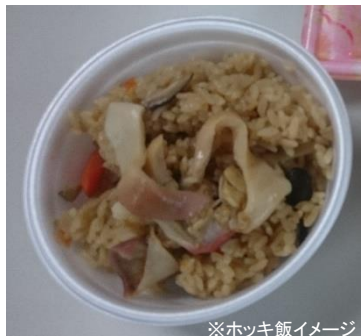
※ホッキ飯イメージ