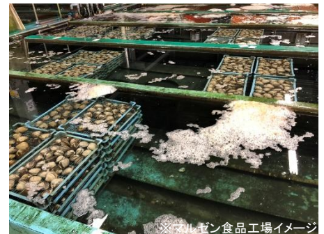
※マルゼン食品工場イメージ